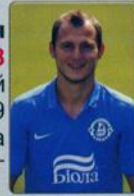
Роман Зозуля №18 Нападающий 17.11.1989 Украина Рост 176 см, вес 62 кг