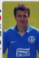
Руслан Ротань №29 Полузащитник 29.10.1981 Украина Рост 174 см, вес 67 кг