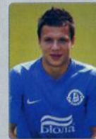
Евгений Коноплянка №10 Полузащитник 29.09.1989 Украина Рост 176 см, вес 69 кг