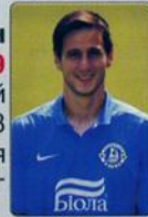
Никола Калинич №9 Нападающий 05.01.1988 Хорватия Рост 187 см, вес 81 кг